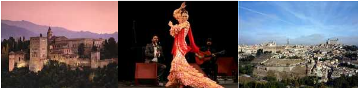
夕暮れ時のアルハンブラ宮殿